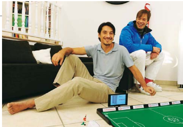
Fußballstar Ivica Vastic und Ski-Ass Thomas Sykora: Zwei glückliche Besitzer einer Harreither Komplettlösung zum gesunden Heizen und Kühlen sind sich einig: „Die Harreither Systemlösungen schaffen für unsere Familien Behaglichkeit zu allen vier Jahreszeiten in den eigenen vier Wänden.“

ponenten zueinander passen wie die Zahnräder in einem Getriebe. Um im Bild zu bleiben: Man hat nichts vom stärksten Motor eines Autos, wenn das Fahrwerk schwächelt – die Performance des gesamten Systems zählt – bei Autos ebenso wie in der Haustechnik. Harreither – einer für alles? Ein einziges System für Revitalisierung und Neubau? Hochflexibel, wirtschaftlich, hochqualitativ, umweltfreundlich und behaglich? Ja, Sie dürfen es glauben! Überzeugen Sie sich jedoch selbst bei einem von 171 Harreither Systempartnern oder unter www.harreither.com . Harreither ist eine bekannte österreichische Marke für hochwertigste und zukunftssichere Haustechnik. Was wären aber all die genialen technischen Lösungen ohne ... Menschen? Menschen die im Dienste der Behaglichkeit Tag für Tag ihr Bestes geben! Harreither ist sich bewusst, dass ein Unternehmen nur mit gelebter sozialer Kompetenz erfolgreich sein kann. Ob Kunde, Mitarbeiter oder Geschäftspartner – der Mensch steht im Mittelpunkt.