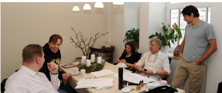
Aufgrund des Zeitdruckes war eine gründliche Vorbesprechung notwendig. Bei einem Kaffee besprach das Team den Ablauf des Drehtages.