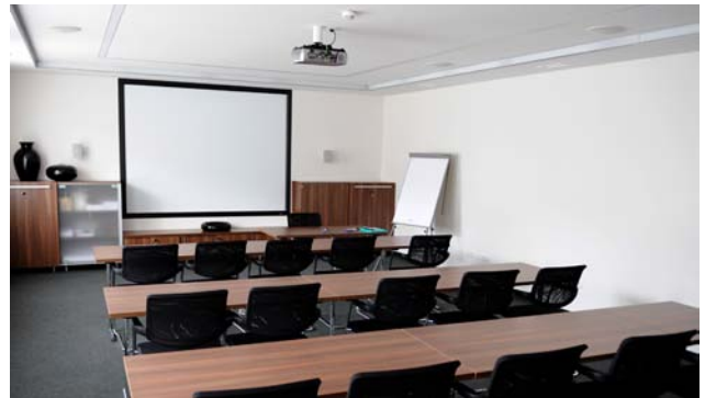
Der Euroval® Wärmeboden, die Hitherm® Klimawand sowie die Modul Klimadecke sorgen im neuen Seminarraum (oben) bzw. im neuen Besprechungsraum (unten) für angenehmes Klima zu allen vier Jahreszeiten.