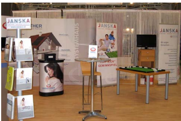
Der Harreither Systempartner Janska veranstaltete bei der Messe in Wiener Neustadt ein Harreither Tipp-Kick Gewinnspiel.