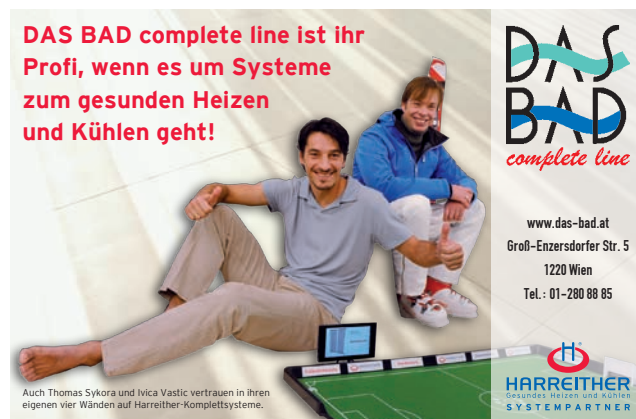
Der Harreither Systempartner Das Bad schaltete dieses Inserat in der Beilage Immo im Kurier der Samstagsausgabe.