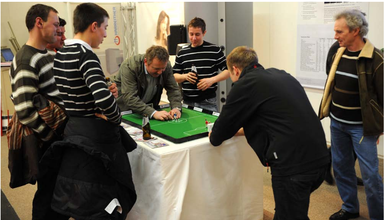
Bis ins letzte Detail wurde die erste Werbekampagne von Harreither durchgezogen. Bei der Energiesparmesse in Wels erwies sich die Weltpremiere des ersten Tipp-Kick Spiels mit einer Harreither Rasenheizung als wahrer Besuchermagnet.

che sich nach ersten Auswertungen mehr als nur lohnen wird. Insgesamt lukrierte die Firma Harreither durch diese gezielten Aktivitäten über 1000 wertvolle Kundenkontakte. Der Verkaufsdienst arbeitet auf Hochtouren, um diese sorgfältig zu bearbeiten und an die entsprechenden Systempartner weiterzuleiten. Die genauen Zahlen bezüglich des „Return on Invest“ wird man frühestens in einem halben Jahr präsentieren können - der Erfolg ist aber bei entsprechender Konsequenz in der Nachbearbeitung schon jetzt nicht aufzuhalten. Einen Imagegewinn kann man heute schon feiern.