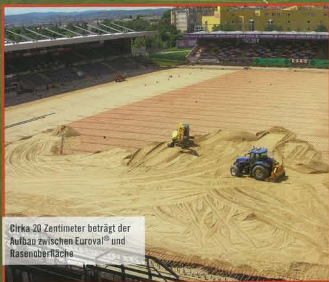
Cirka 20 Zentimeter beträgt der Aufbau zwischen Euroval® und Rasenoberfläche