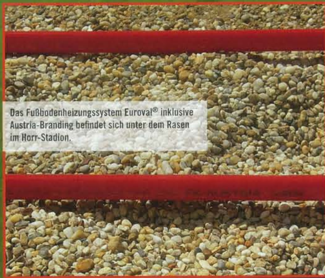
Das Fußbodenheizungssystem Euroval® inklusive Austria-Branding befindet sich unter dem Rasen im Horr-Stadion.