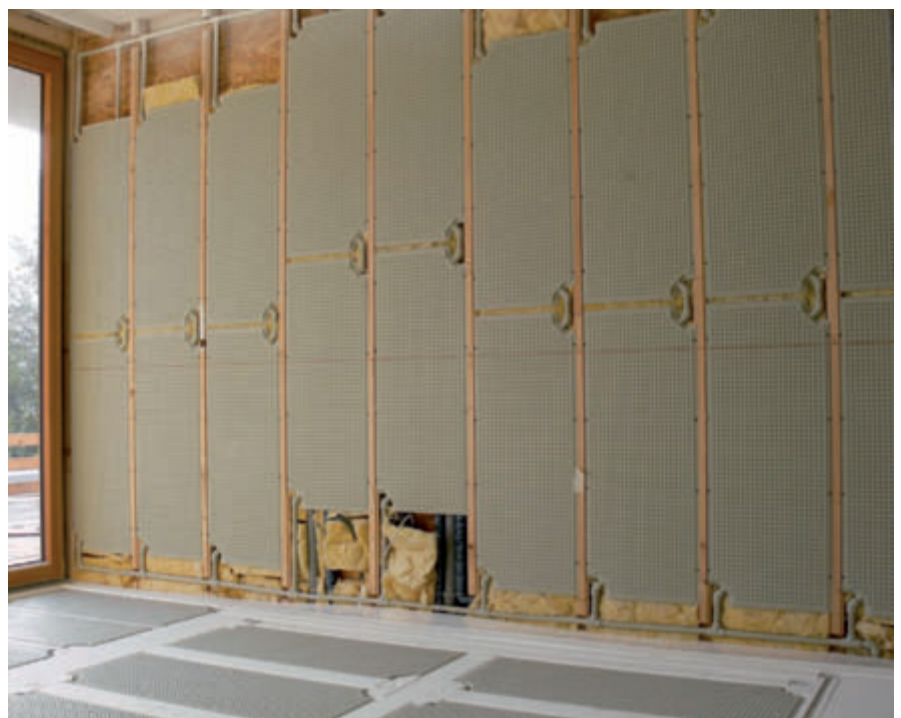
Die effizienteste und wirtschaftlichste Kombination: Der Modul Klimaboden im Boden und in der Wand verringert die Vorlauftemperaturen erheblich und hilft so Heizkosten zu sparen. Und das alles bei gesteigerter Behaglichkeit - kurz: Die Premiumklasse zum gesunden Heizen und Kühlen.

Neben dem ausgezeichneten thermodynamischen Verhalten legt Harreither auch auf höchste Fertigungsqualität und robuste, baustellen-gerechte Ausführung großes Augenmerk. Bei den Modul Klimaelementen zeigt sich das in Form von sehr hohen Innendruckfestigkeiten (über 40 bar) und ausgezeichneter mechanischer Belastbarkeit (hohe Punktlasten) – kurz und gut: Topqualität aus Österreich! Nähere Informationen unter www.harreither.com