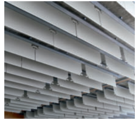
Die Modul Klimadecke zeichnet sich auch durch die Einfachheit in der Montage und ihre Flexibilität (beispielsweise bei Lichtauslässen) aus.

Im modernen Wohnbau präsentiert der Modul Klimaboden seine überzeugendsten Vorteile. Große Glasflächen in Verbindung mit Holzriegelkonstruktionen führen dazu, dass Außenklimaschwankungen sehr rasch innen spürbar werden. Daher sind rasch regelbare Heiz- und